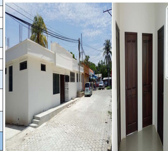
Centro de Salud Rio Hondo Zacapa Cod SNIP 151136