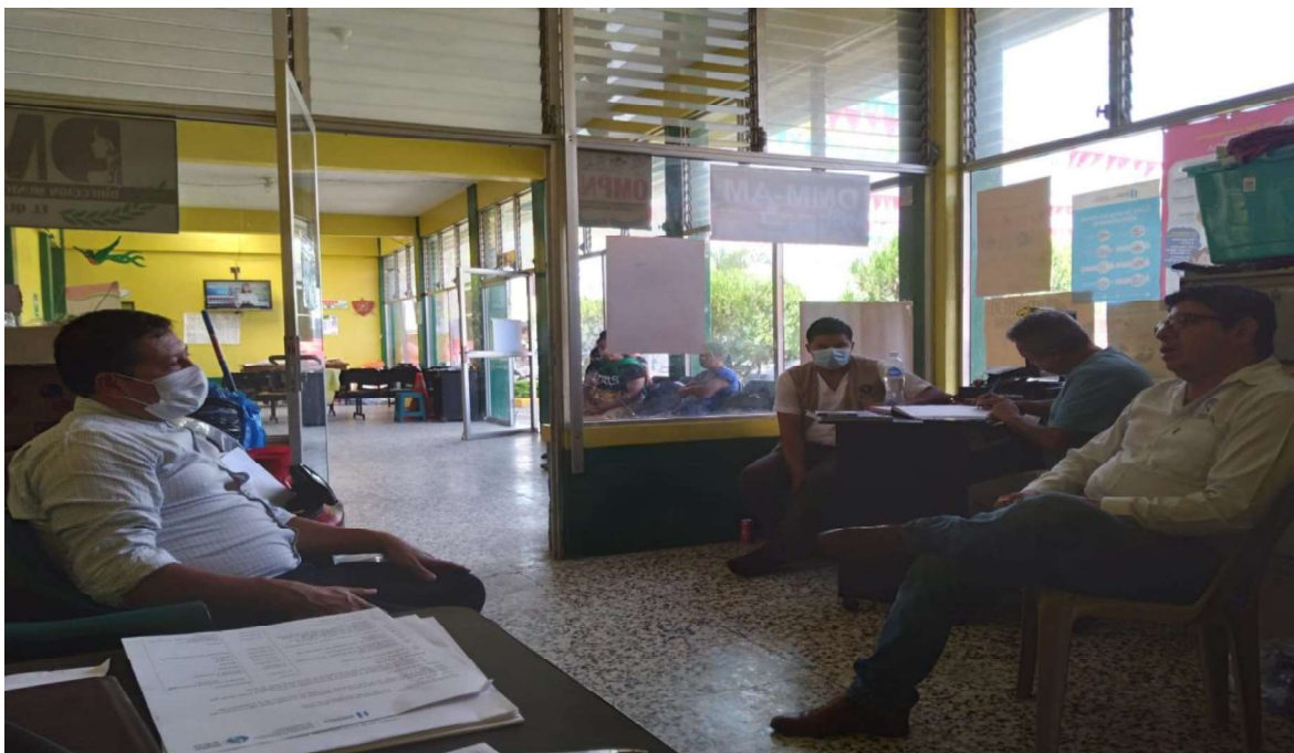
Reunión de comude

Coordinación con las instituciones para solicitar el apoyo para ayudas para el municipio y comunidades