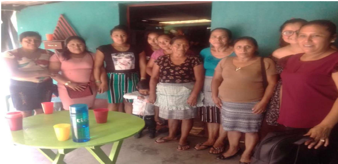
ATENCION AL PUBLICO