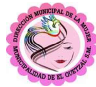
Atencion al adulto mayor