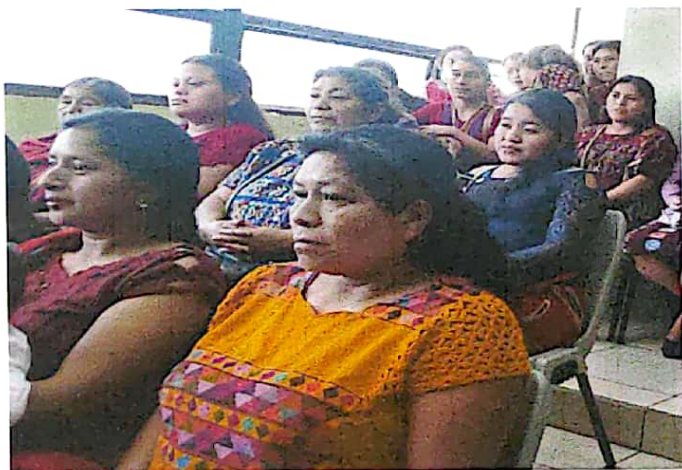
Reuniones con lideresa de diferentes Comunidades.