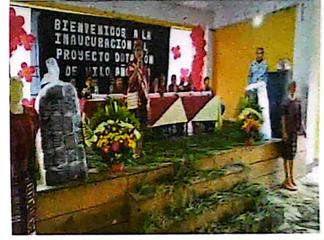
Entrega del Proyecto Apoyo a la Cultura en la Dotación de Hilos a mujeres para la elaboración de Indumentaria Maya año 2023. Para Mujeres con Escasos Recursos Económicos