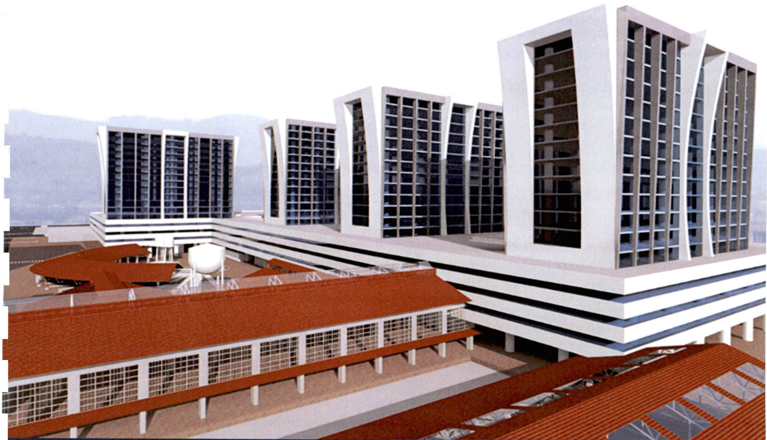
Estación Aeronáutica Escuintla - Puerto Quetzal