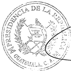
ALEJANDRO GIAMMATTEI FALLA