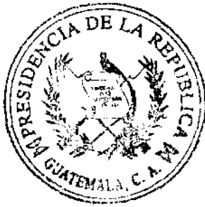
OTTO FERNANDO PEREZ MOLINA

Pavel Vinicio Centeno López MINISTRO DE FINANZAS PUBLICAS