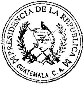
OTTO FERNANDO PÉREZ MOLINA