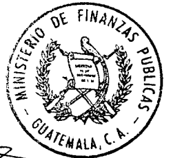
Juan Alberto Fuentes K. MINISTRO DE FINANZAS PUBLICAS