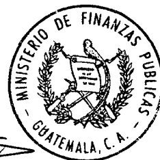
Juan Alberto Fuentes K. MINISTRO DE FINANZAS PUBLICAS