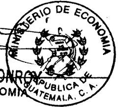
RUBEN MORALES MONROY MINISTRO DE ECONOMIA