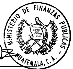
Juan Alberto Fuentes K. MINISTRO DE FINANZAS PUBLICAS