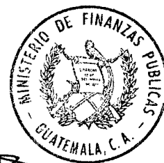
Juan Alberto Fuentes K. MINISTRO DE FINANZAS PUBLICAS