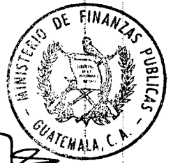
Juan Alberto Fuentes K. MINISTRO DE FINANZAS PUBLICAS