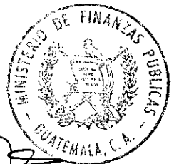
Juan Alberto Fuentes K. MINISTRO DE FINANZAS PUBLICAS