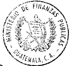
Juan Alberto Fuentes K. MINISTRO DE FINANZAS PUBLICAS