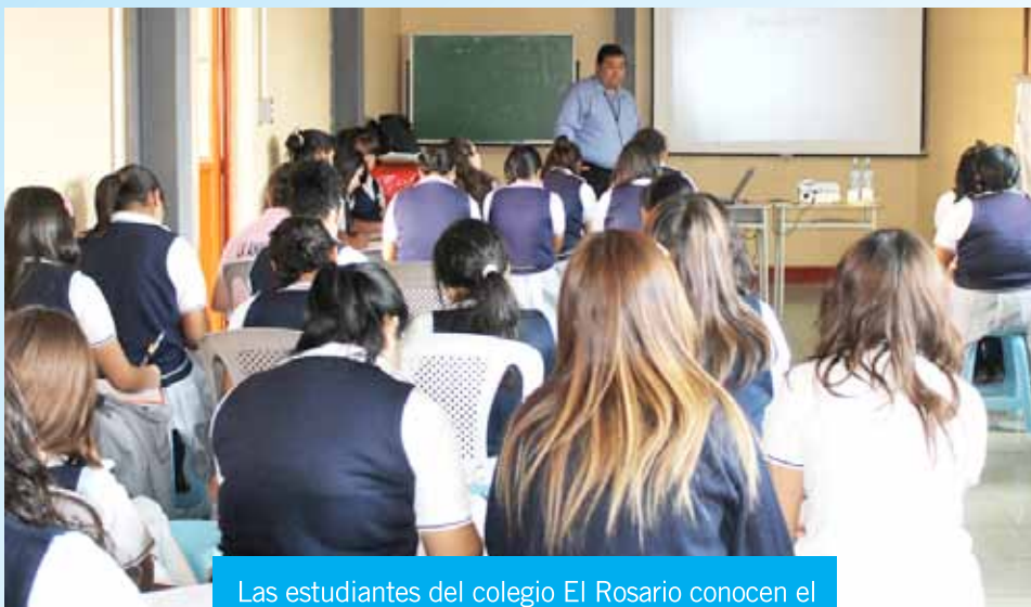
Las estudiantes del colegio El Rosario conocen el funcionamiento de Guatecompras.