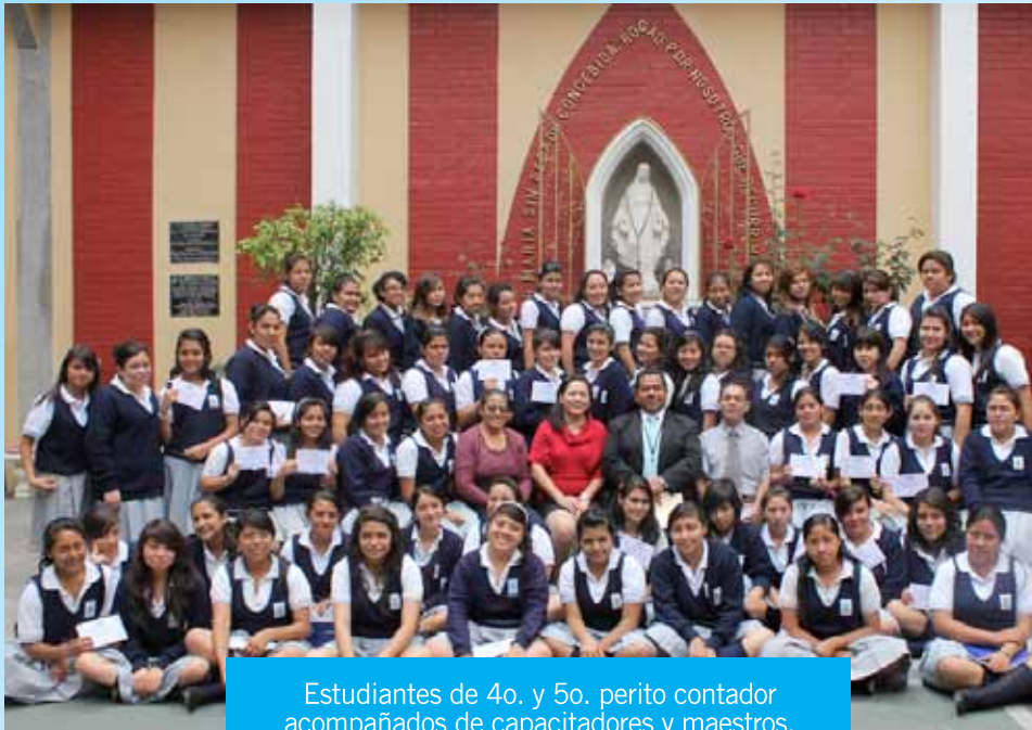
Estudiantes de 4o. y 5o. perito contador acompañados de capacitadores y maestros.