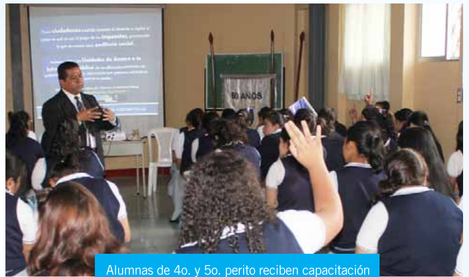
Alumnas de 4o. y 5o. perito reciben capacitación sobre las generalidades del MINFIN.

► Como parte del Programa Cultura Fiscal que coordina Comunicación Social con el apoyo de otras direcciones del Ministerio de Finanzas Públicas (Minfin), personal de esta institución impartieron durante los días 12, 13, 19 y 20 de marzo capacitación sobre Historia, Generalidades del Ministerio de Finanzas Públicas, Cultura Fiscal, Tratados de Libre Comercio, Guatecompras y Sistema de Contabilidad Integrado (Sicoin) a estudiantes de la carrera de Perito Contador del Colegio de Señoritas El Rosario.