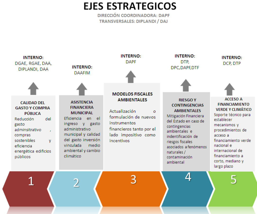
Figura II. Ejes estratégicos de la EFA y su vinculación con las Direcciones

mecanismos de implementación, incluidos los relacionados con la cooperación internacional y el compromiso del sector privado para acompañar la transición hacia las metas del desarrollo sostenible, en tanto que el derecho al desarrollo es una responsabilidad del Estado y, como tal, todos deben contribuir desde sus posibilidades, competencias y responsabilidades.