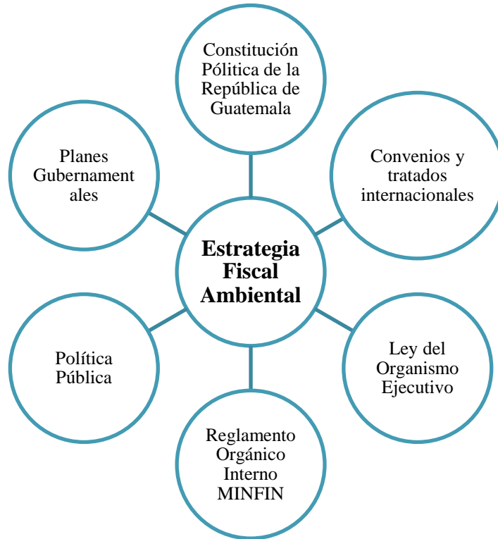
Figura I. Marco institucional y vinculación legal