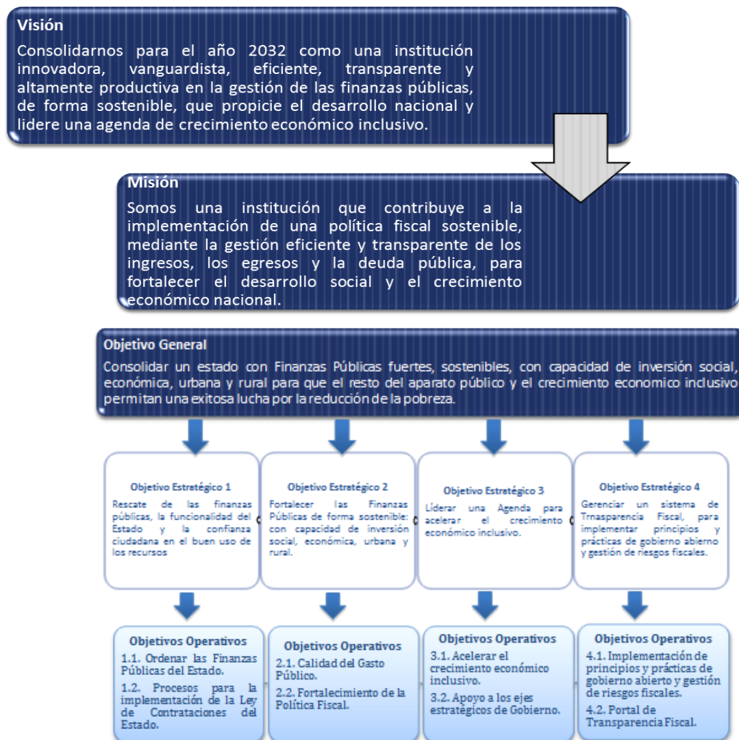
Ilustración 2. Ministerio de Finanzas Públicas, Marco Estratégico del Plan Estratégico Institucional 2020-2026

Fuente: Dirección de Planificación y Desarrollo Institucional, Ministerio de Finanzas Públicas.