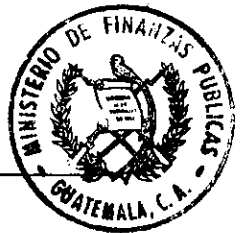
Pavel V. Centeno MINISTRO DE FINANZAS PUBLICAS